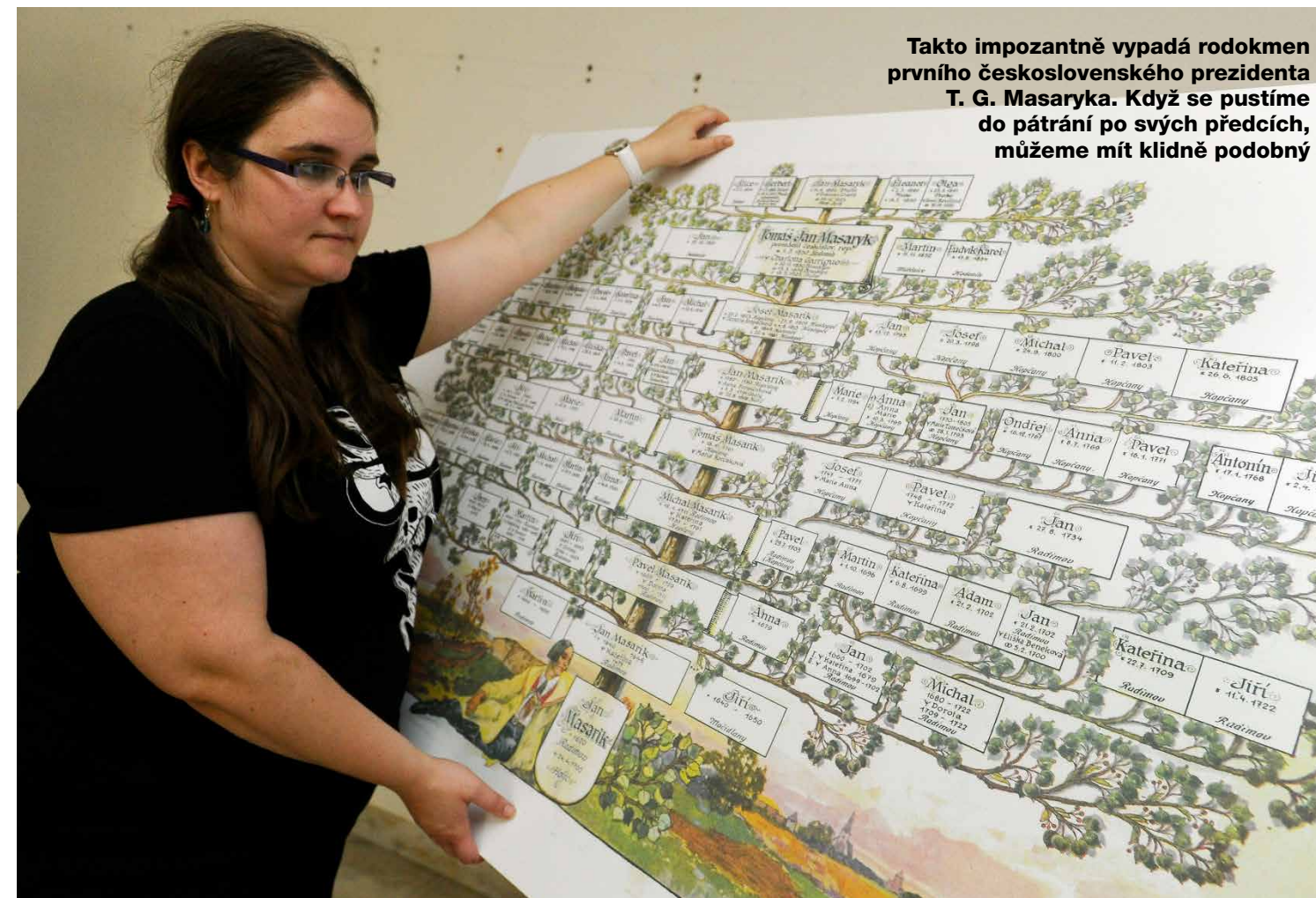
Takto impozantně vypadá rodokmen prvního československého prezidenta T. G. Masaryka. Když se pustíme do pátrání po svých předcích, můžeme mít klidné podobný

O svých předcích lze zjistit mnohé na internetu z pohodlí domova. Začít pátrat tak může opravdu každý.